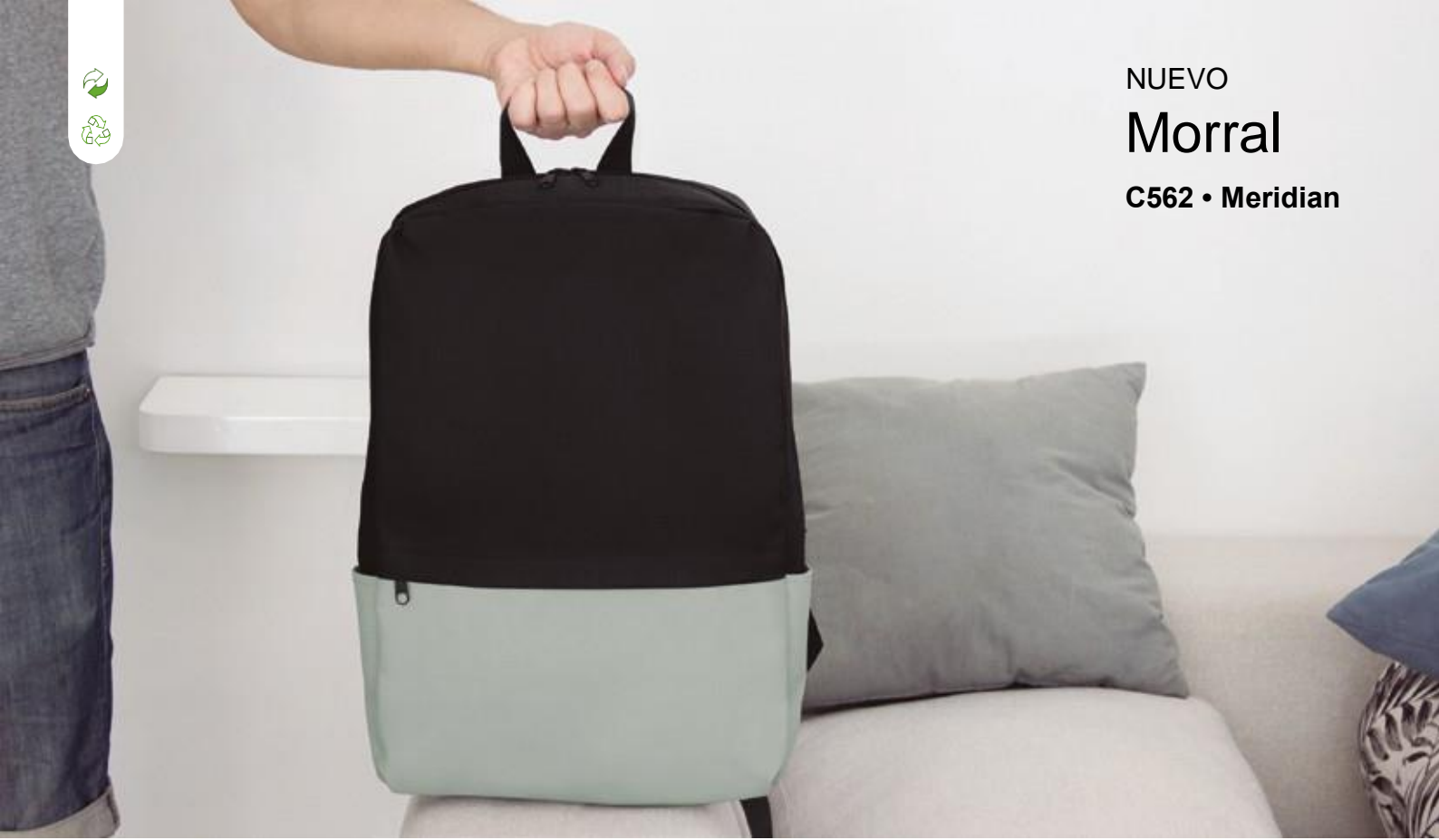
NUEVO Morral C562 • Meridian