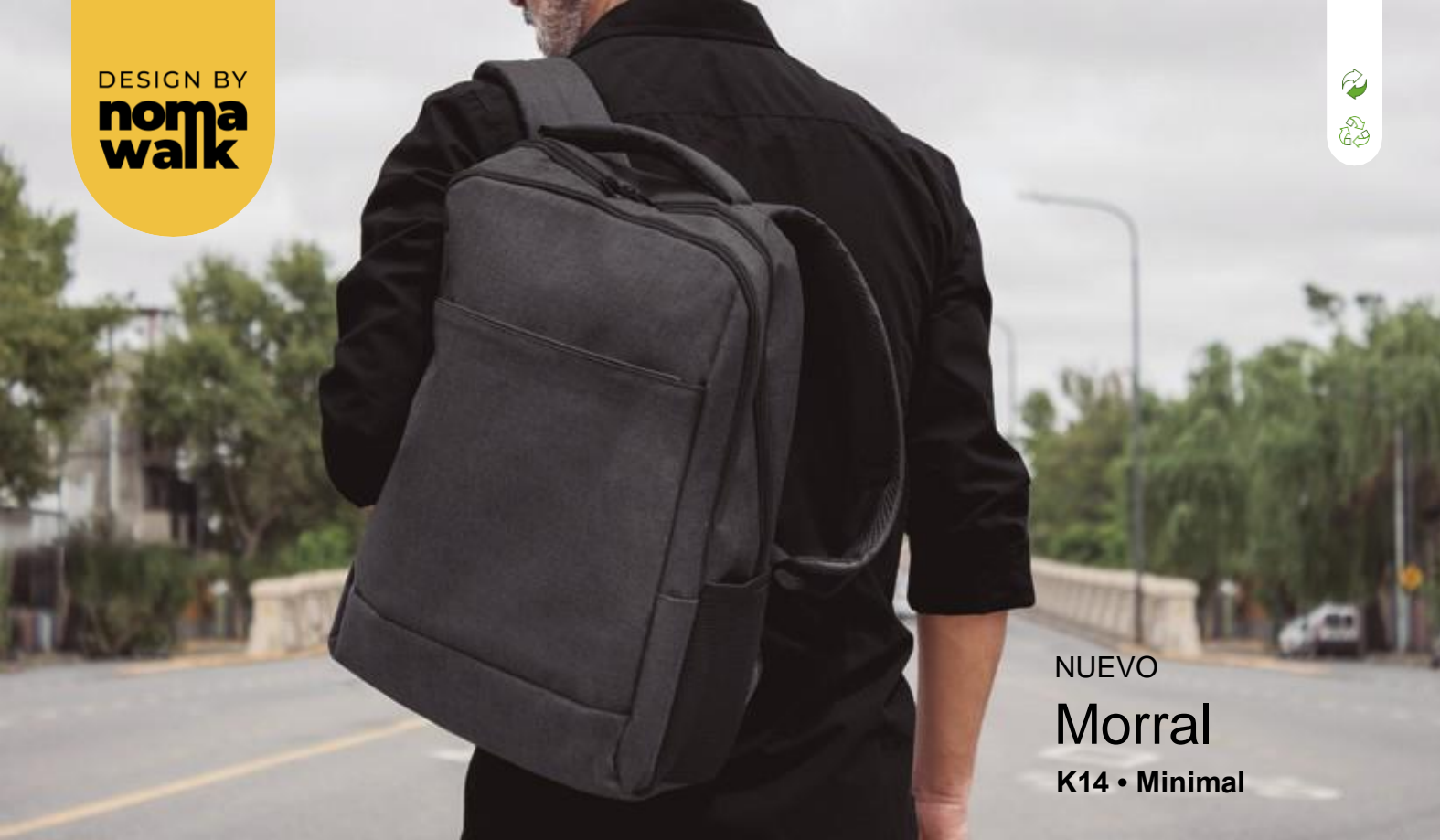
NUEVO Morral K14 • Minimal