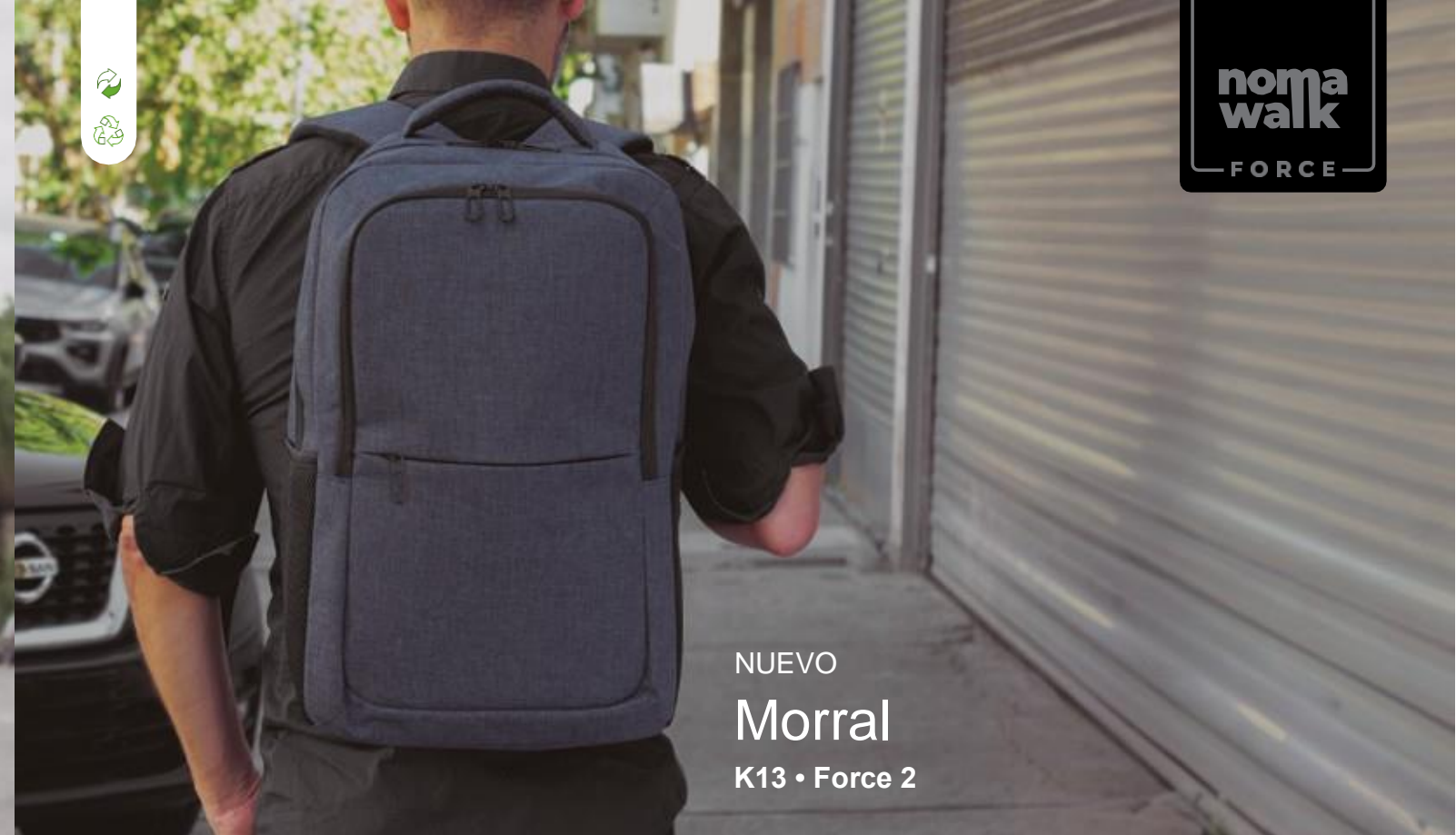
NUEVO Morral K13 • Force 2