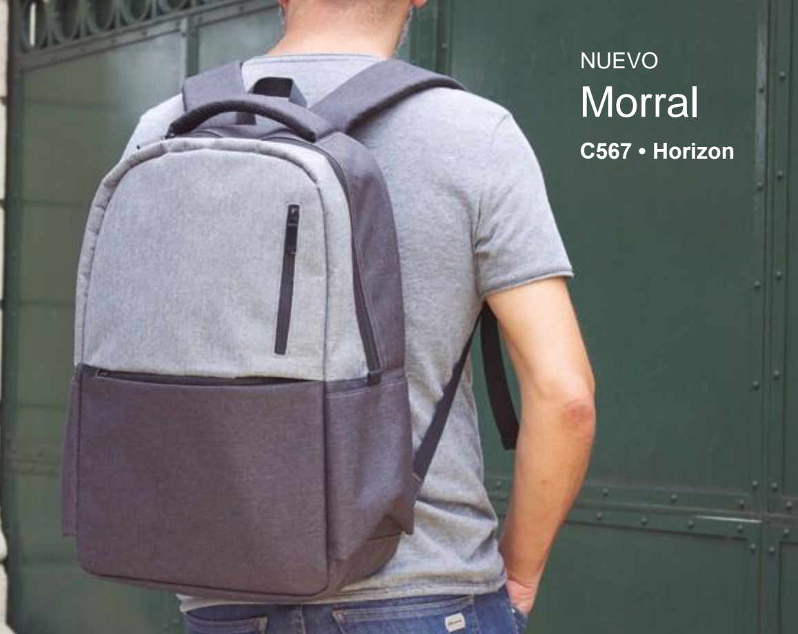
NUEVO Morral C567 • Horizon