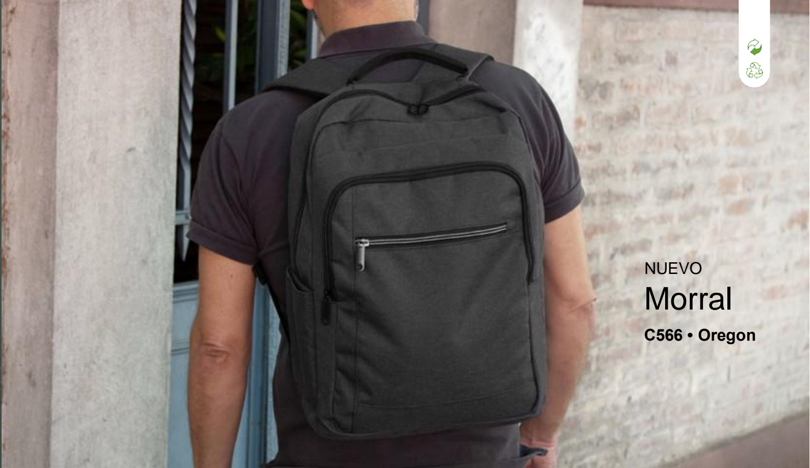
NUEVO Morral C566 • Oregon